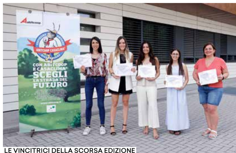
LE VINCITRICI DELLA SCORSA EDIZIONE

ti nel loro percorso accademico, conferma le caratteristiche della scorsa edizione: possono concorrere solo laureati di secondo livello (magistrale ex DM 270/2004 o magistrale a ciclo unico), ed è stato innalzato il voto finale di laurea, che non deve essere inferiore al