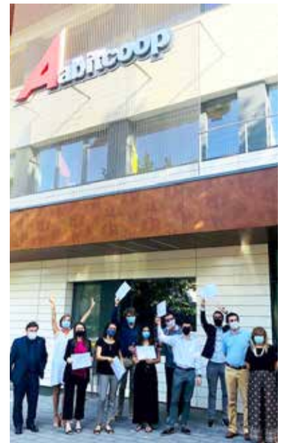
I VINCITORI DELLA SCORSA EDIZIONE

La cerimonia di consegna dei premi si terrà il 23 giugno prossimo in occasione della seduta del Consiglio di Amministrazione.