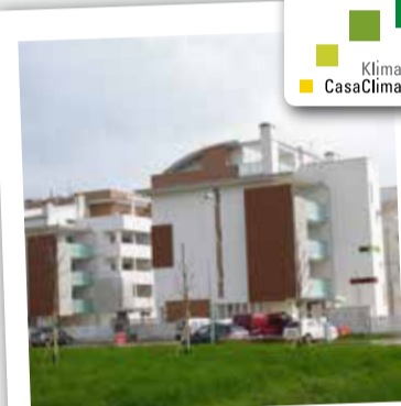
Modena, via De Andrè 2 appartamenti da € 264.000