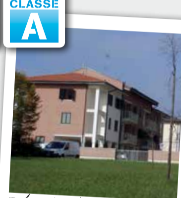
Vignola, Bettolino 2 appartamenti da € 181.700