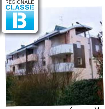
Modena, via Venturelli 1 appartamento da € 575.000