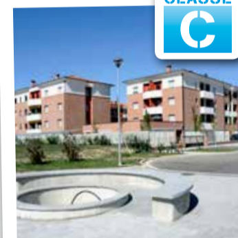
Limidi, viale Italia 1 appartamento da € 179.000