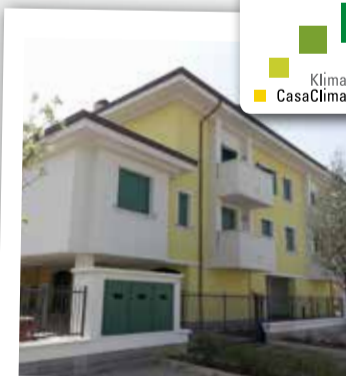
Carpi, Canalvecchio 1 appartamento da € 296.000