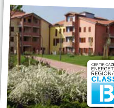
Fossoli, Parco Remesina 1 appartamento da € 149.000