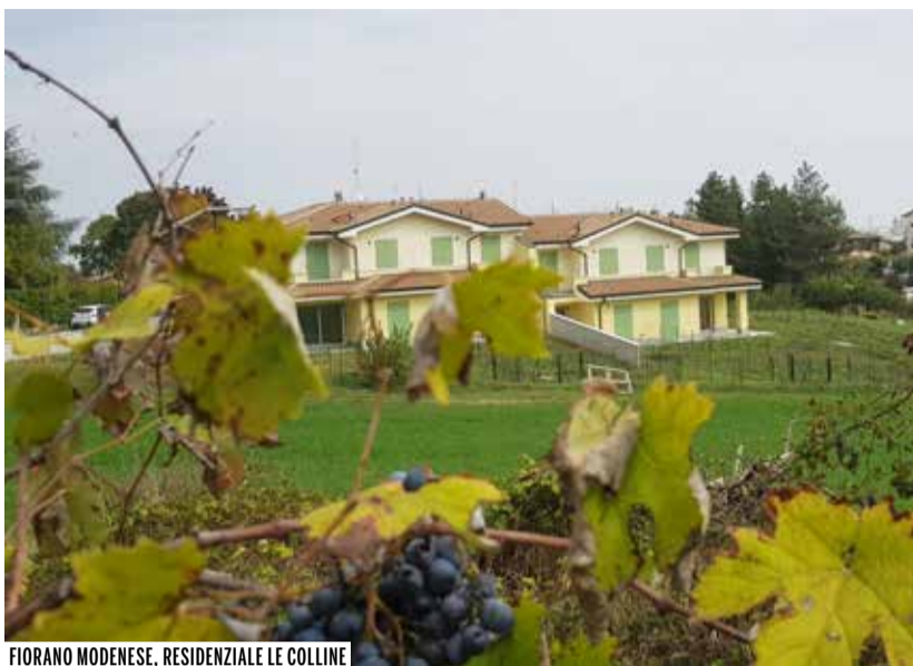
FIORANO MODENESE, RESIDENZIALE LE COLLINE

Il 14 ottobre si sono aperti i Bandi di Santa Caterina a Modena per l'assegnazione in proprietà convenzionata nell'ambito del PEEP n° 2 e 62 Santa Caterina di 4 alloggi ultimati nel 2009, di Nonantola per l'assegnazione in godimento temporaneo degli alloggi in costruzione nel Comparto Prati lotto C consegna anno 2021 e di Fiorano per l'assegnazione in godimento temporaneo delle villette del Residenziale Le Colline consegna anno 2020.